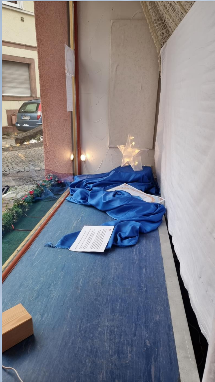
Aufbau vor Ort